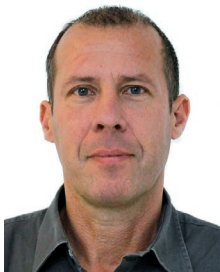
Autor: Peter Jendros Product Manager Display Division DATA MODUL AG www.data-modul.com

Die eigentliche Licht-Emissionsschicht, bestehend aus Kohlenstoffmolekülen, gibt bei Stromfluss Energie in Form von Licht ab. Um einen effizienten Stromfluss zu gewährleisten, wird die Leuchtschicht von