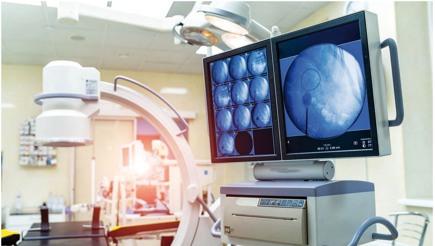
Bild 3: OLEDs sind in der Medizintechnik unverzichtbar, dank ihrer herausragenden Darstellungseigenschaften in Diagnosegeräten. Das detailreiche Bild mit hohen Kontrasten ermöglicht präzise Diagnosen.